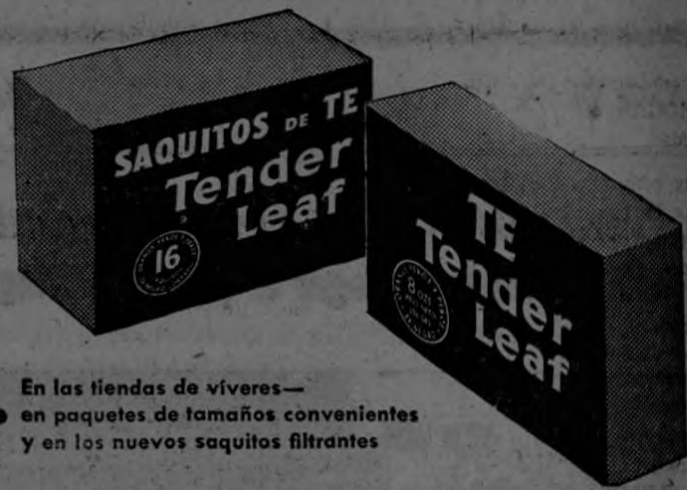
En las tiendas de víveres— en paquetes de tamaños convenientes y en los nuevos saquitos filtrantes